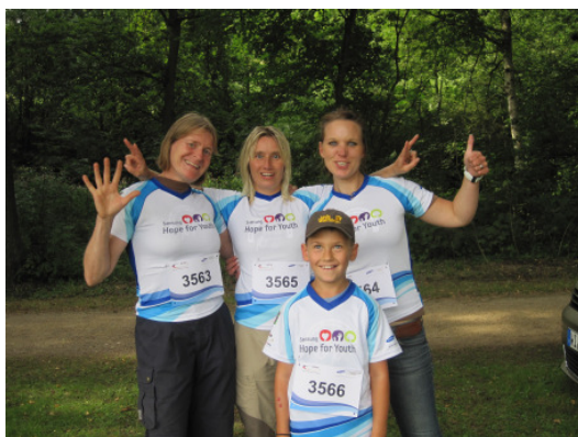
Charitylauf für einen guten Zweck Zur Belohnung gab es ein T-Shirt