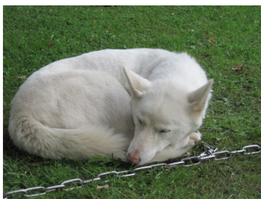
...es war ein anstrengender Tag für Mensch und Hund !!