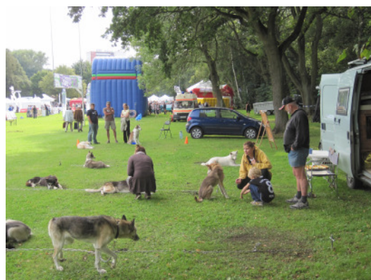
Platz auf der Moorteichwiese