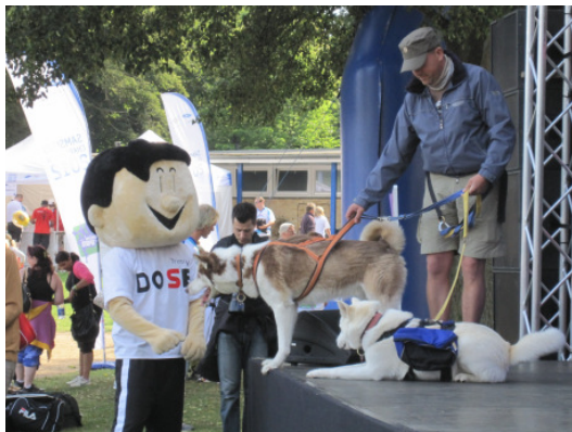
Trimmy, das Maskottchen des Deutschen Olympischen Sportbundes