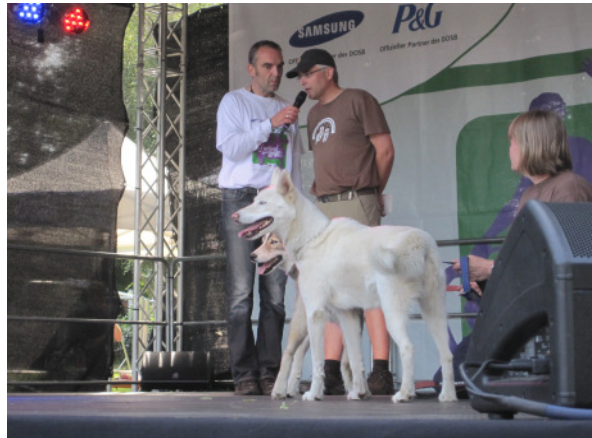
Interview auf der Bühne Moorteichwiese